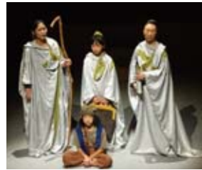
▲昨年の公演の様子