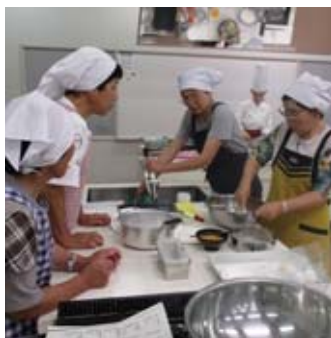
▲特産品の岸根栗を使ったお 菓子を作るあぐりがーる

美和町の各農事組合法人などの女 性たちが地域の活性化を目指して活 動する様子を紹介