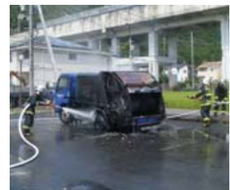
▲全焼したごみ収集車

カセットボンベ・スプレー缶・ライターを「金属類及び破砕ごみ」には絶対に入れないでください！