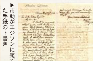
▶市助がエジソンに宛てた手紙の下書き