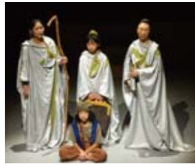
▲昨年の公演の様子