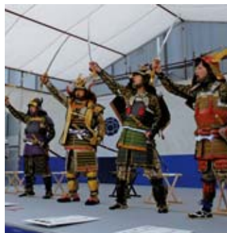
▲勇壮な武者による出陣を再 現する鞍掛城まつりの様子