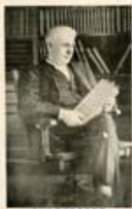
▶藤岡家に伝わっていたエジソンの絵はがき

※1 工部大学校：市助が教授を務めていた大学 ※2 エアトン教授：工部大学校で市助に電気工学を教え、日本で最初に電灯を点灯した