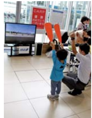
空の日フェスタ (岩国錦帯橋空港)

9月22日、岩国錦帯橋空港で「空の日フェスタ」が開催され、さまざまなイベントが行われました。