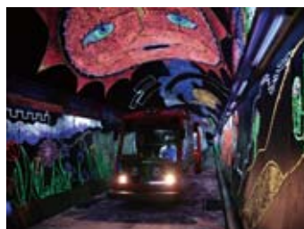
▲きらら夢トンネル