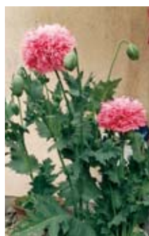
▲ソムニフェルム種