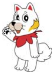
ひろしま都市犬 「はっしー」

進めてきた連携や交流を基に「ヒト・モノ・カネ・情報が巡る都市圏」「どこに住んでも安心で暮らしやすい都市圏」「住民の満足度が高い行政サービスを展開できる都市圏」の実現を目指し、新たな取り組みを行っていきます。 ☎政策企画課 ☎295013